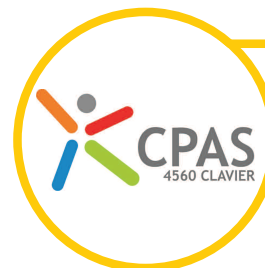
Assistante de vie - CLAVIER

04/383 99 80 - 0488/40 03 95 maud.verjans@anthisnes.be